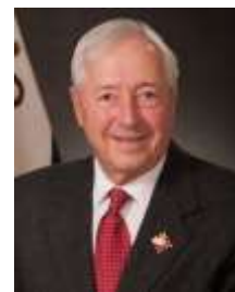
L'Hon. J. Michel Doyon, Lt-gouverneur du Québec

Cabinet du Lieutenant-gouverneur du Québec Édifice André-Laurendeau, RC 1050, rue des Parlementaires Québec (Québec) G1A 1A1